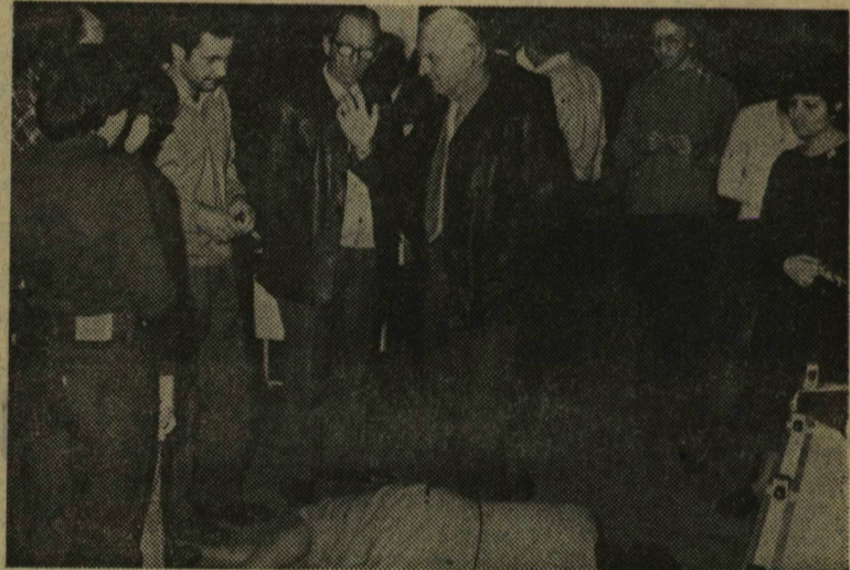
„Konzílium a szakmai héten