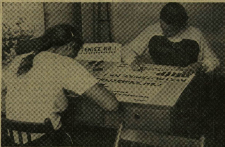
Önkéntes sportpropagandisták — avagy plakátraajzók

— Ebben az évben indítjuk be a SZOTE-n a szakkollégiumokat. Hisztológiai, szexológiai, nyelvi szakkollégiumaink tema-