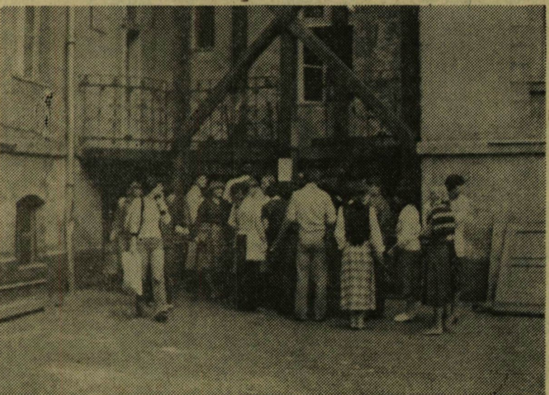
Kollégisták „kedvence” időtöltése...

(Többi kollégiumunk terveiről lapunk következő számában írunk.)