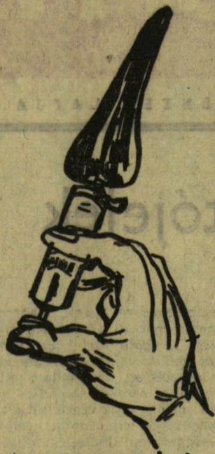
VIZIÓ A PAPRIKARÓL

PIKÓ BÉLA, a „Saját szakállunkra” brigád tagja