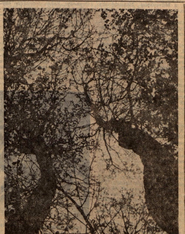
„Itt van az ősz, itt van újra...”