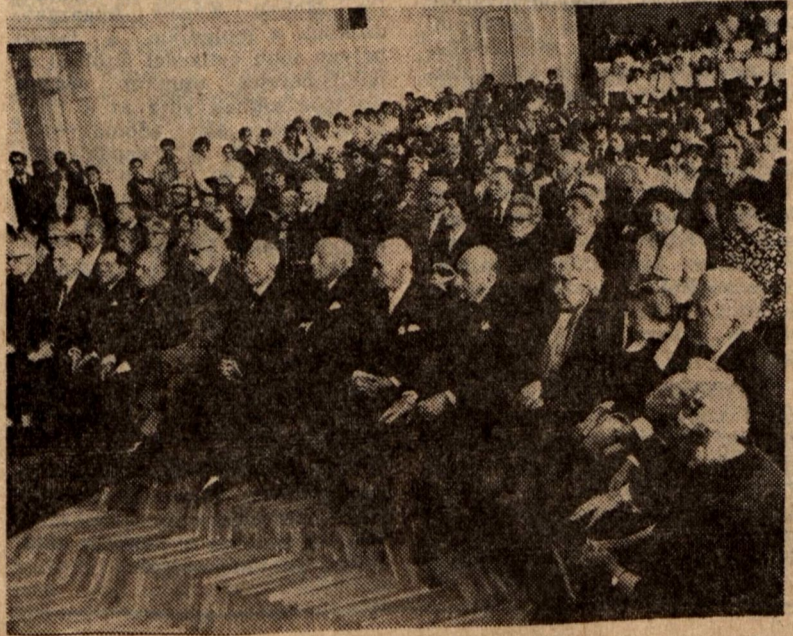
A jubileumi diplomával kitüntetettek egy csoportja