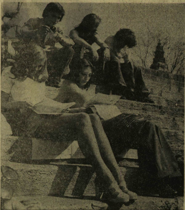
NÉHANY NAPIG TAVASZ VOLT...