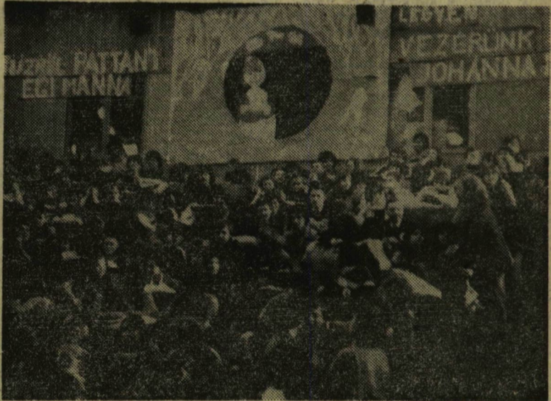
A választópolgárok népes serege az Aud. Max.-ban