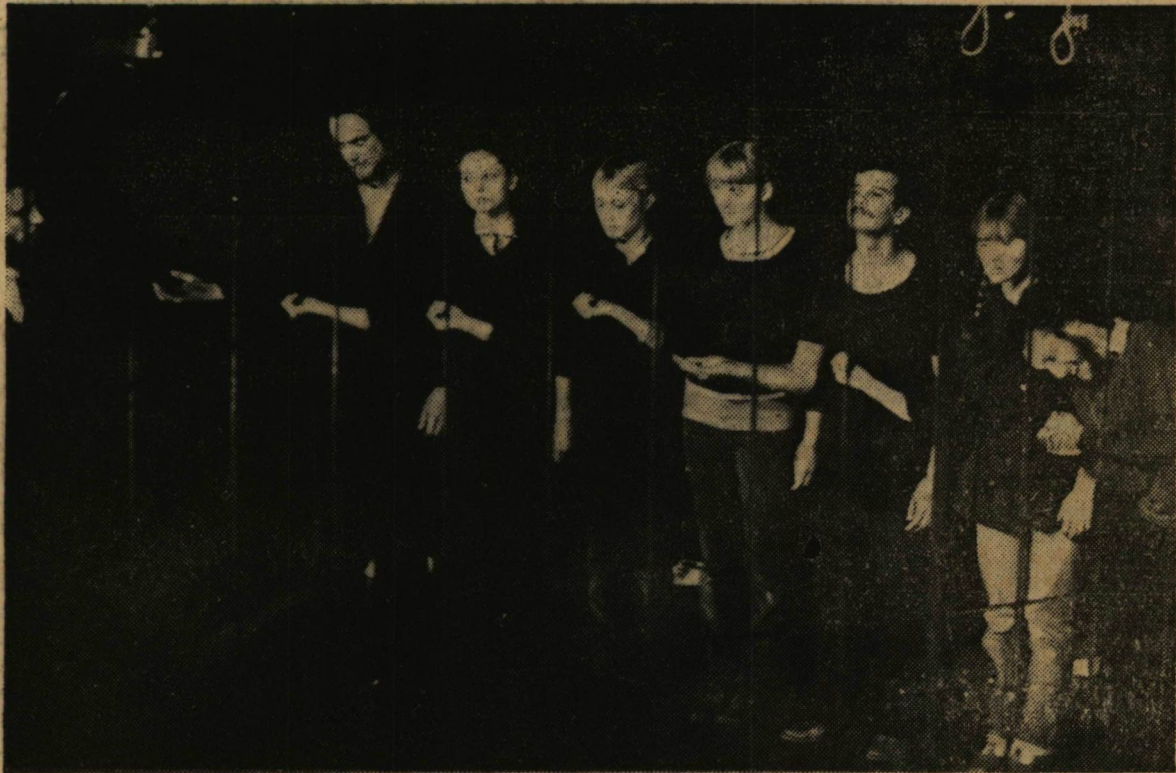
Jelenet a JATE-színpad bemutatójából

A kör tagjai névadóknak, esküvőkön mutatnak be rövid műsorösszeállításokat, illetve a nagyobb szabású emlékműsorokon is fellépnek. A rendszeres szereplések mellett a Radnóti Irodalmi Kör országos minősítő vizsgák készítését, melyet október 6-8 között rendeznek meg Balassagyarmaton.