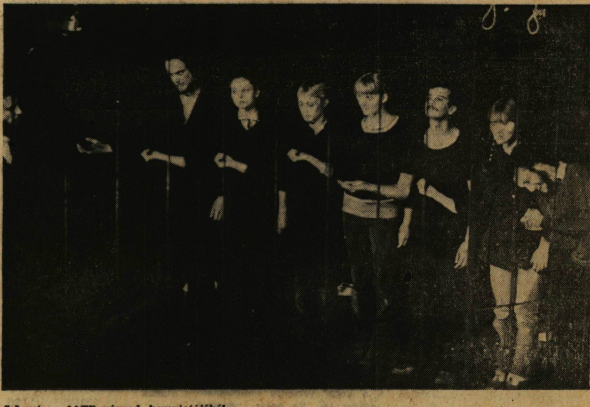
Jelenet a JATE-színpad bemutatójából

A kör tagjai névadókon, esküvőkön mutatnak be rövid műsorösszeállításokat, illetve a nagyobb szabású emlékműsorokon is fellépnek. A rendszeres szereplések mellett a Radnóti Irodalmi Kör országos minősítő vizsgák készítését, melyet október 6–8 között rendeznek meg Balassagyarmaton.