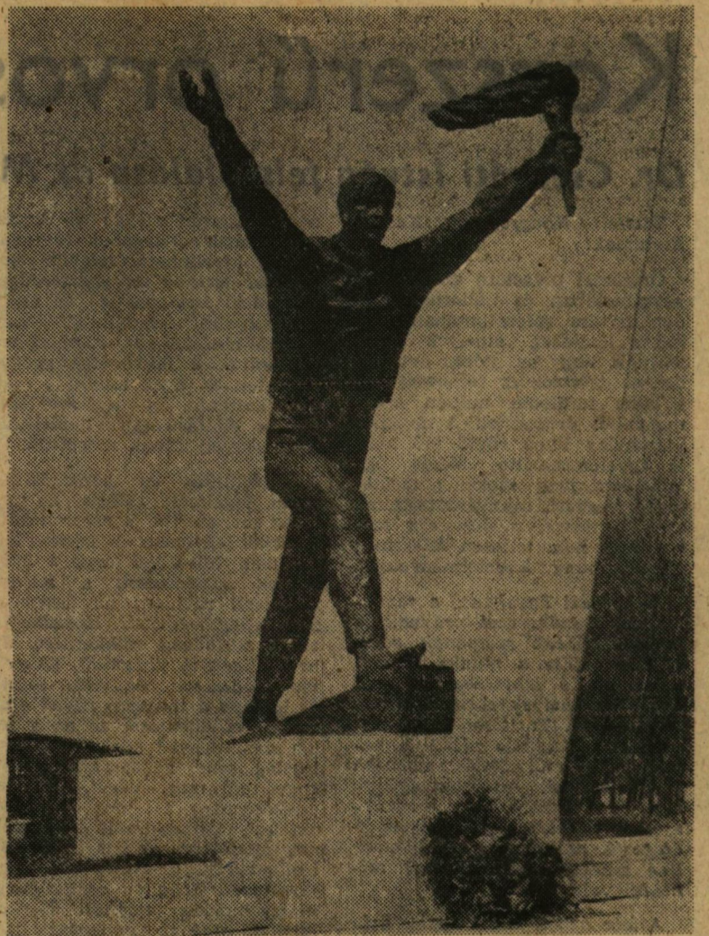
Szabó László: Felszabadulási Emlékmű