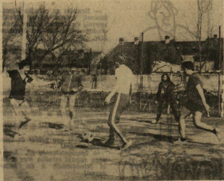
„Egy kicsi mozgás mindenkinek kell...”

A Szegedi Orvostudományi Egyetem a múlt évi összetett verseny győzteseként utazik Budapestre. Reméljük, hogy ez évben is sikerül folytatniuk jó szereplésüket.