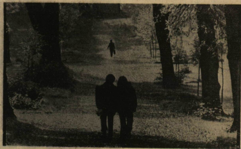
„Árnyas erdőben szeretnék élni...”

A programsorozat utolsó napján, március 14-én rendezték meg a politikai vetélkedőt. Ennek eredményhirdetésére és a Politikai Hét ünnepélyes zárására 20 órakor került sor.