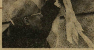
Dr. Szőkefalvi Nagy Béla professzor koszorút helyeztet az emléktáblára

Volt az MTA elnökségi tagja (1961–69), ez idő alatt a Szegedi Akadémiai Bizottság elnöke is. Munkássága elismeréseként 1951-ben Kossuth-díjat kapott, 1953-ban a Munka érdemrend arany fokozata kitüntetésben részesült, kétszer is elnyerte „Az oktatásügy kiváló dolgozója” kitüntetést (1956, 1961).