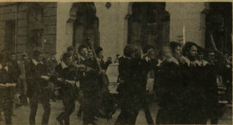
Az idei jogászbálra az egész várost igyekeztek a rendezők megmozgítani. Hangulatos torbortartották a belvárosban — mint a bál bizonyította, sikerrel.

Oktatási Minisztérium Kulturális Minisztérium KISZ Központi Bizottság