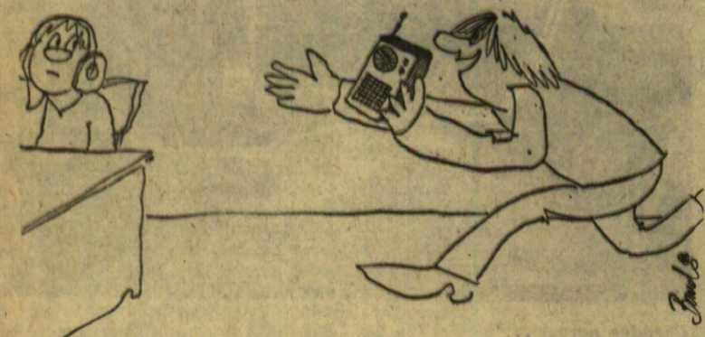
— Gyerekek! Kaptunk egy táskarádiót!