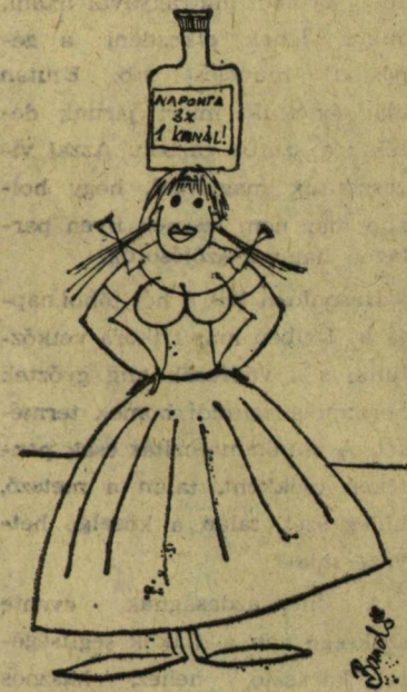
„Üveges tánc” — medicus módra

Ez év utolsó negyedében látogatnak el többek között produkcióikkal a budapesti Allatorvostudományi Egyetem Klubjába, a SOTE és a Vár klubba, a kecskeméti Művelődési Házba és Marosvásárhelyre. A vendég szereplések mellett a színpad most teljes erővel — november 24-én — szentesen megrendezésre kerülő minősítő versenyre készül, valamint az ezt mindössze egy hónappal követő balassagyarmati XIV. Országos Madách Imre Színjátszó Napokra. Természetesen szegedi közönségükről sem feledkeznek meg, az elmúlt hónapban is két bemutatóval jelentkeztek hazai színpadon. Nemrég láthattuk nagy közönségsiker aratott komédiájukat, valamint a Nemzetközi Gyermekév alkalmából összeállított „Engedjétek hozzám jönni a gyermekeket” című műsorukat. A vidéki fellépések nagy száma, a hazai bemutatók sűrűsége és a versenyeken való jó helytállás nagy terhet jelent az együttes tagjainak, hiszen a fellépések előtti „nagyüzemet” éjszakákon át tartó kemény próbák jellemzik. Ezt a terhet azonban szívesen vállalja az együttes 16 tagja, hiszen a gyakori együttlétek baráti társasággá kovácsolták őket. Az Ifjúsági Házbeli találkozó számukra a legkedvezőbb időpontban lesz, mert a szakmai zsűri elemző-értékelő véleményét hasznosítani tudják majd a szentesi minősítő versenyen.