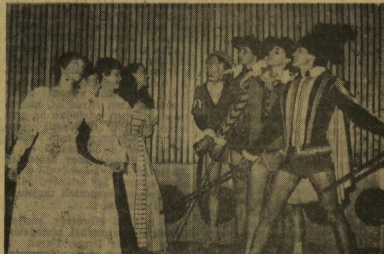
Felsorakozik a hölgyek és lovagok csapata