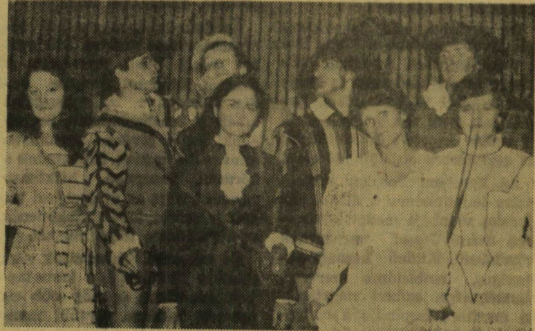
Együtt a díszes társaság.