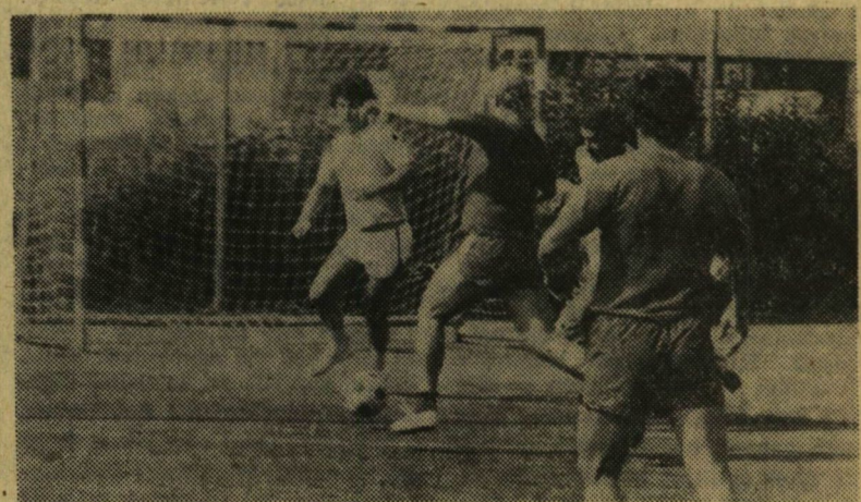
A SZOTE-DOTE mérkőzés egy mozzanata az egészségügyi dolgozók Szegeden megrendezett spartakiáján