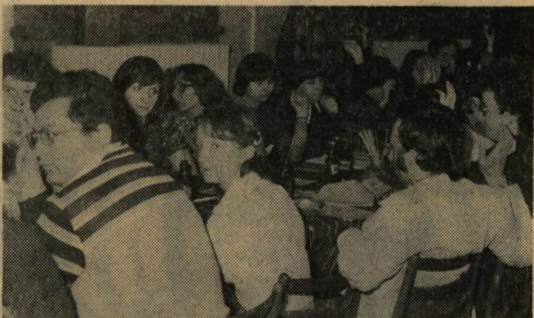
Szavaznak a SZOTE KISZ-szervezetének küldöttei