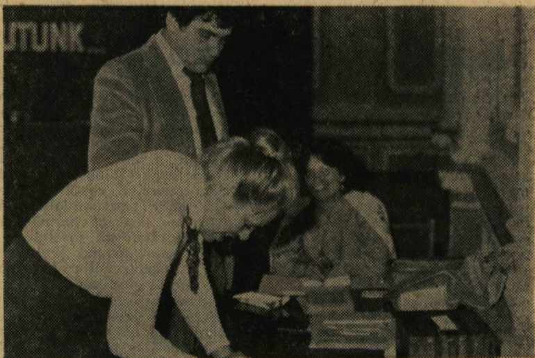
Munkában a szavazatszedő bizottság

A felszólalók többsége a beszámolóhoz fűzött kiegészítést. A hozzászólásokban szó volt a kollégiumok tevékenységéről, a művészeti csoportok támogatásának lehetőségeiről, az egyetemi tömegsport jelenlegi helyzetéről, a felvételi előkészítő bizottságok munkájáról. Javaslat hangzott el az évenkénti értékeléssel együttjáró adminisztrációs munka csökkentésére. E mellett a küldöttek hosszasan foglalkoztak az alapszervezeti munka jobbá tételének lehetőségeivel is. A felvetett kérdésekre dr. Csernus Sándor válaszolt.