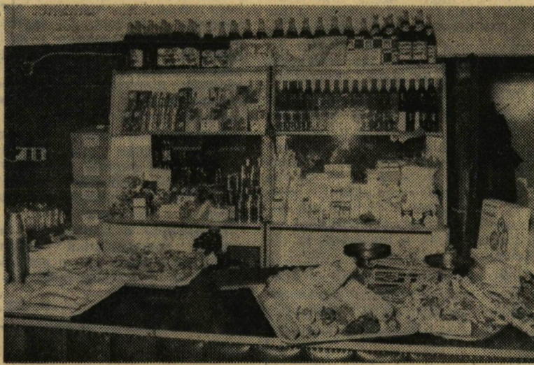
„Almaink menzai éléskamrája”