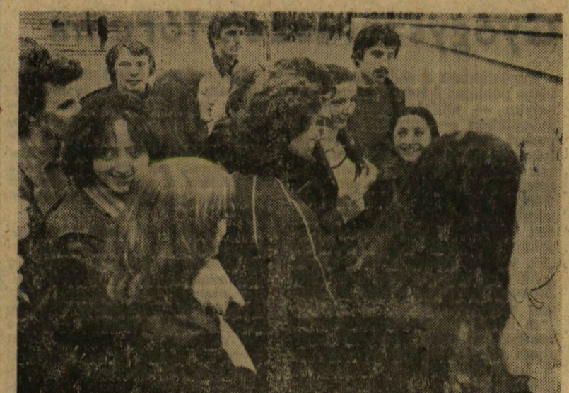
És a végén közösen rájöttünk, hogy jól szórakoztunk!

elmondhatjuk, hogy ezt sikerül leküzdenünk, sőt igénylik, hogy leüljünk velük „csak úgy” beszélgetni különböző témákról. Elvileg kéthetente járunk ki, de ez a gyakorlatban úgy realizálódik, hogy fél év elején hetente is kint vagyunk, azután a vizsgaidőszak közeledtével kevesebb az idő, ritkábban jutunk ki. Kezdetben voltak olyan problémák is, hogy a tanárok nem mindig a legnagyobb lelkesedéssel fogadtak bennünket. Az idén az egyetemi KISZ-bizottság kezébe vette a patronálás ügyeket; most az iskolával együttműködési szerződést kötnek. Bízunk abban, hogy így az iskola vezetésénél is nagyobb támogatásban lesz részünk, nagyobb megbecsülésben részesítik munkánkat.