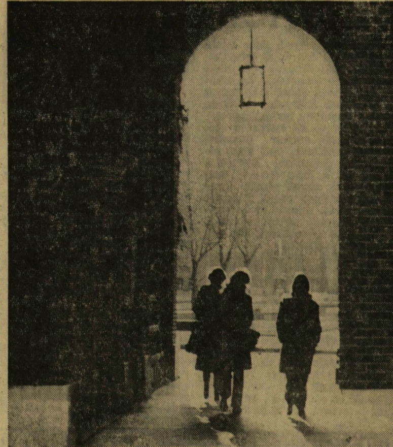
Aradi tér