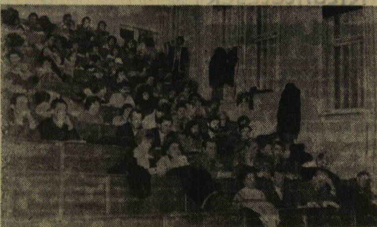
A parlamenten jelenlevők figyelmesen hallgatták a beszámolóit

Az írásban beadott kérdések jelentős része foglalkozott a tanulmányi ösztöndíjak problémájával. Sérelmezték a hallgatók, hogy bár a kategóriahatárok módosultak, a gyakorlati megvalósításra nem kapnak megfelelő anyagi keretet. Elhangzott olyan javaslat is, hogy a tanulmányi ösztöndíjak odaítélésénél fokozottan figyelembe kellene venni a ténylegesen végzett munkát.