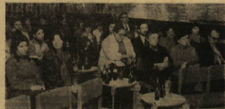
A tanácskozás résztvevőinek egy csoportja