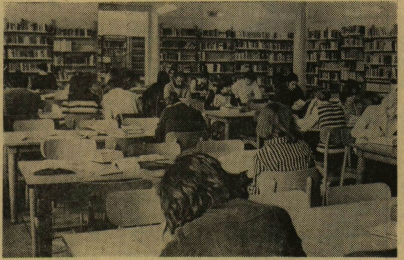
A Központi könyvtár társadalomtudományi olvasóterme

könyvtára is kölcsön veheti például a 28 millió kötetes moszkvai Allami Lenin Könyvtár, a 18 millió kötetet elérő washingtoni Library of Congress, a 13 millió kötetet meghaladó londoni British Library, a 7 millió kötetes párizsi Bibliothèque Nationale, a 2 millió kötetet birtokló budapesti Országos Széchényi Könyvtár és természetesen a 600 ezer kötetet meghaladó szegedi József Attila Tudományegyetem Központi Könyvtára kölcsönözhető kiadványait vagy azok másolatát. A könyvtárak ismertett együttműködése tehát megszünteti a szakember és a leendő szakember elszigeteltségét, lényegében az emberiség írásba foglalt ismereteinek használójává teszi.