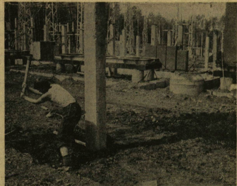
Az építőmunka egy pillanata

s főleg minden magyar számára érthető nevek. Egyébként voltak munkaszervezési problémák, bár ez magyarázható a nagy távolságokkal. Képzeld el, hogy a legközelebbi anyagfelvevő hely is több száz kilométerre volt a munka helyszínétől. Így fordulhatott elő, hogy az előre kiszámított építési anyag elfogyott, s mi munka nélkül maradtunk. Néha azért jól is esett az ilyen pihenő, hisz a betonozás meg a hozzá kapcsolódó műveletek bizony fárasztóak voltak.