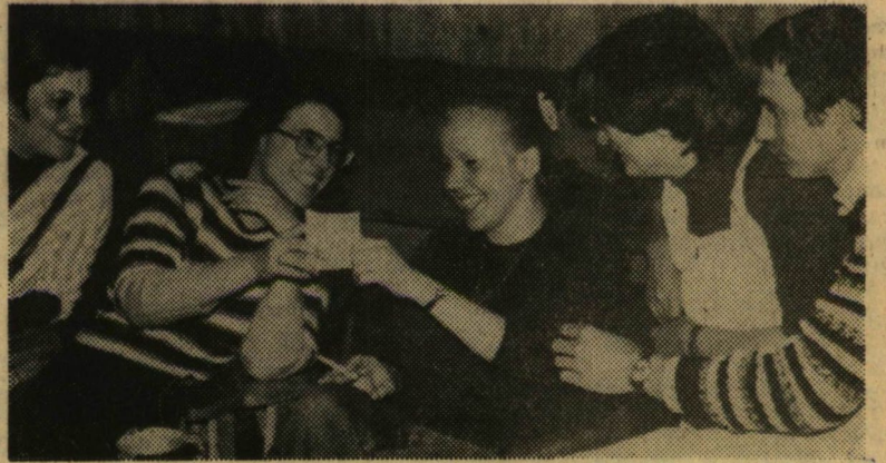
Akik a tapasztalatokat elmondták

ván orgonál a Dómban, közreműködik Gregor József. Augusztus 12-én a tanácsháza udvarán a Szegedi Kamarazenekar hangversenye (vezényel Pál Tamás). Augusztus 15-én a budapesti Madrigál Kórus hangversenye a tanácsháza udvarán. Könyvzene: Június 26-én a Skorpó együttes koncertje. Augusztus 28-án a Fonográf együttes koncertje. Folklor program: Július 13—31. Dán néptánc tábor. Augusztus 6—13. Nemzetközi néptánc szeminárium. Tudományos programok: Július 13—22. XV. Pedagógiai Nyári Egyetem. Július 25—augusztus 3. A VII. Művelődéseméleti Nyári Egyetem. Augusztus 25—31. Algebrai módszerek a Graaf-elméletben. (JATE Biológiai Intézet). Sport: Július 22. Nemzetközi Marathoni Verseny. Július 23. Országos meghívásos úszóverseny. Augusztus 4—6. Nemzetközi Kézilabda Kupa a Rókusi Sportpályán. Augusztus 12—13. Nemzetközi Motorcsónak Verseny a Tiszaán. Augusztus 16—18. Nemzetközi Labdarúgó Kupa. A Szabadtéri Játékok műsorai: Hunyadi László (július 22., 23., 29. augusztus 5.) Bánk bán (július 23., 28., 30.) Az Allami Népi Együttes műsora (augusztus 4., 6., 12.) János vitéz (augusztus 9., 11., 13., 19.) Coppelia (augusztus 16., 18., 20.)