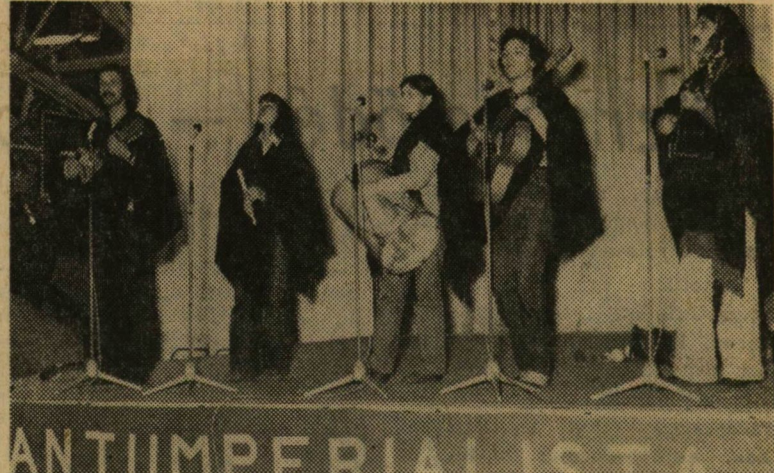
A Tarantella együttes

Kezdetben volt a pince — a központi épület alatt. Meg volt az igény — ifjúsági klub kellene. Aztán jött az ötlet: pince van, klub kell — építsünk hát egyetemi klubot. Utána következett a munka. — 1971. szeptember 27-től 1973. március 31-ig többszáz hallgató és fiatal oktató, az egyetem dolgozói 14 ezer óra társadalmi munkával, az egyetem és a város vezetői két és fél millió forinttal segítettek. És mindezeken után, közös erőfeszítések eredményeként 1973. március 31-én megnyílt a JATE KISZ-klubja.