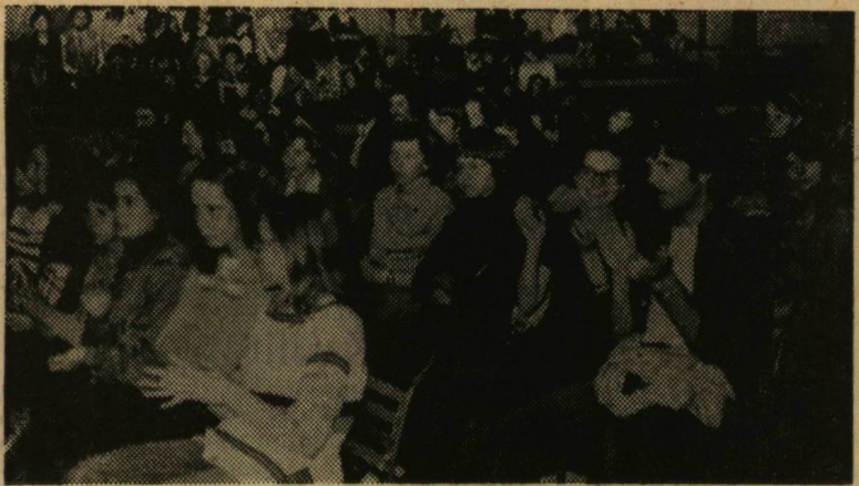
A nézőtérén is igen jó volt a hangulat