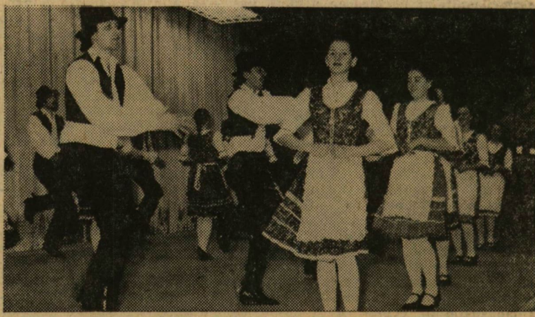
A SZOTE néptáncosportjának fellépése nagy sikert aratott

A leglátványosabb előadással a SZOTE néptáncokara dicsekedhet. Magyar és nemzetiségi táncokból mutattak be egy csokorra valót — fergetegesen. A fekete Afrika üzenetét dobolta dr. Bernardó, majd a kubai diákok táncjátékával ért véget a szolidaritási est.