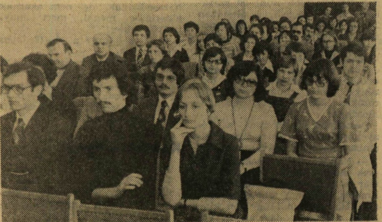
Az ünneplő ifjúkommunisták egy csoportja