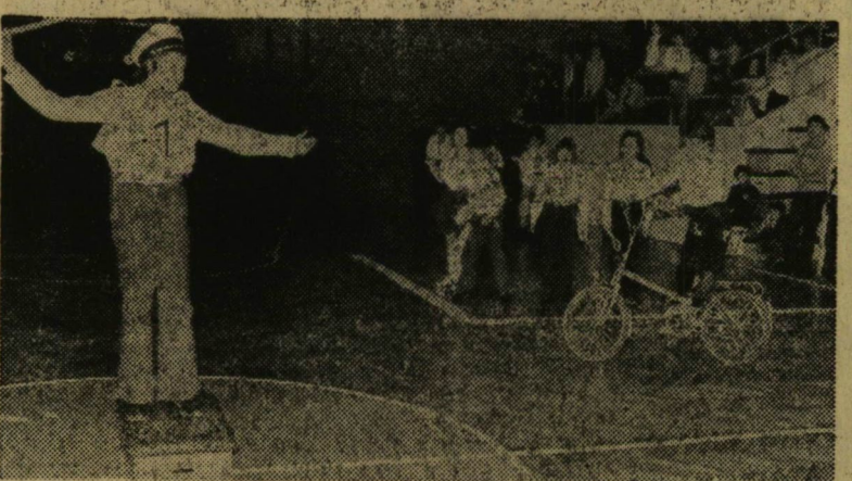
Rendőri forgalmi irányítási próba.