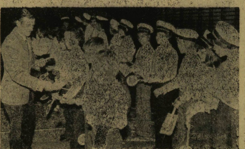
A megyei Rendőrkapitányság ajándékait és társakat kapnak a pártások.