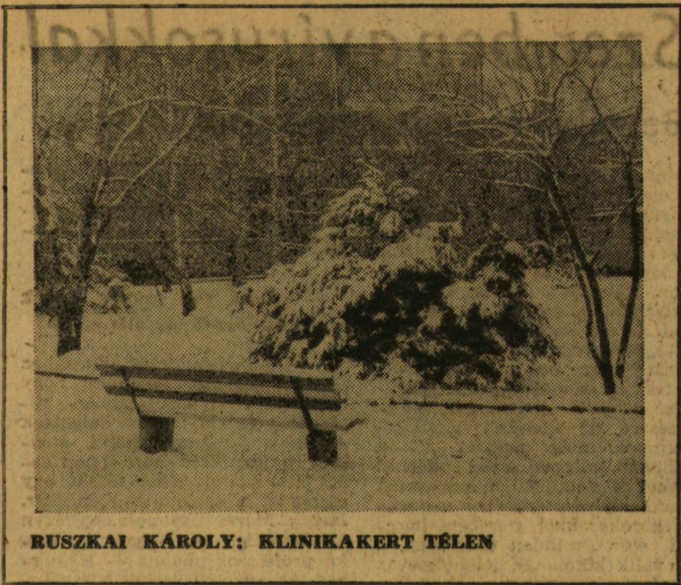
RUSZKAI KÁROLY: KLINIKAKERT TÉLEN