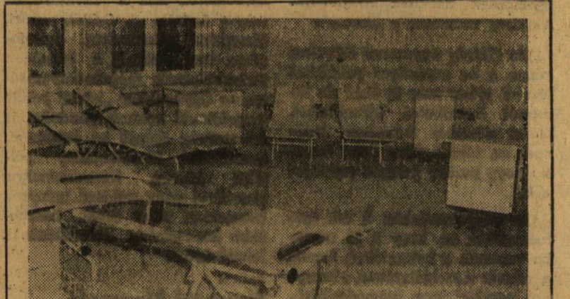
Az orvostudományi egyetemünkön a Nagy Októberi Szocialista Forradalom tiszteletére felavatott Vértanszfúziós Állomás véradószobája

Ugyanúgy, mint a többi intézményben, a főiskolán is hangsúlyozták a szemlélet megváltoztatásának jelentőségét, amely az egész takarékosági akció sikerének a titka lehet. De a legfontosabb, amit külön is ki kell emelni a három intézmény meglátogatása után: csakis a tanszék közötti együttműködéssel, a részérdek leküzdésével lehet komoly eredményeket elérni a takarékosági mozgalomban.