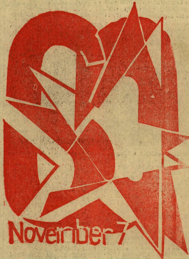
Göcsey József plakátterve