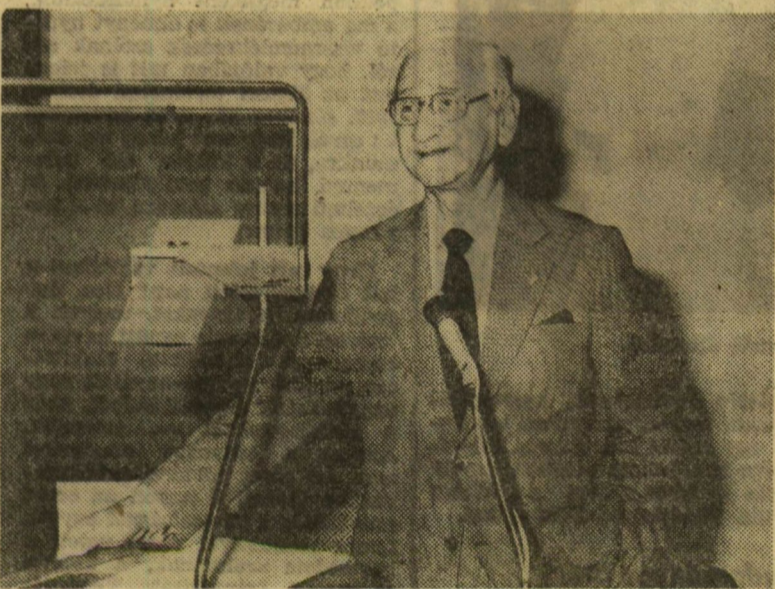
Sabin professzor előadás közben a szemklinikán

mekes anya írta: sohasem felejt el, mit köszönhet neki. Venni szeretett volna a tudósak valamit, de nem tudta, mit is szeretne. Így hát ha meg nem sértil, ezt küldene — ezer forint volt a borítékban — tudja, nagyon jól tudja, milliószer ennyivel sem lehetne