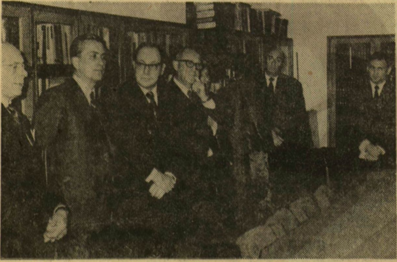
Meghívott vendégek a Központi Kutató Laboratórium könyvtárában

S főleg azok se' bankódhassanak, akik az eddigiekről „lemaradtak”, vagy csak később kapcsolódtak be: jövőre, a második felétől a sorozat folytatódik — kultúrtörténeti köntösben.