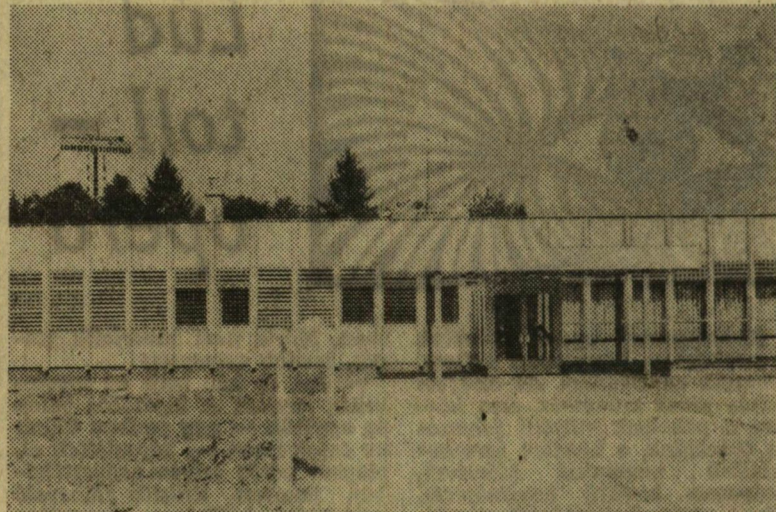
Az egyetem legújabb létesítménye a nemrég átadott újszegedi menza