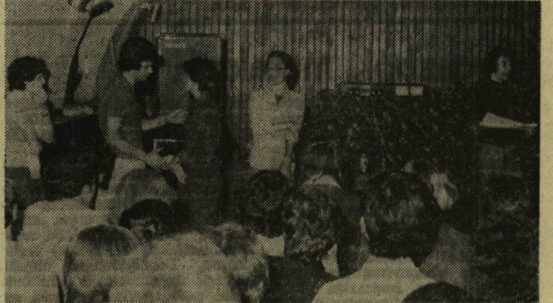
A JATE-s tábor vezetősége a legjobban dolgozókat az építőtábor emlékműjével díszített trikóval jutalmazta

Mindhárom intézményben a DÉLÉP-pel kötött szerződés alapján szervezték meg a munkát. Délelőttönként körülbelül 6—7 óráig dolgoztak, ami nem volt „igazi” építőtábori hajítás, csak ízelítő. Ugyanígy a délutáni rendezvények is az intézmények életébe és a diákhagyományokba való betekintést szolgálták. Meg-