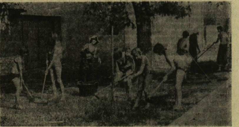
Az egri utcák a szegedi lányok szerszámainak nyomát őrizték ezen a nyáron

Kertész utca parkosításában vesz részt. A mérnökök, munkahelyi vezetők is elismeréssel beszélnek végzett munkájukról. A jó hangulat teremtéséből is alaposan ki-veznek a részüket. Ahogy jó ér-