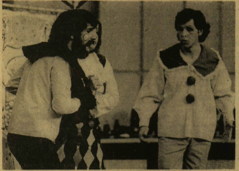
Egy pillanat az operaszínpad egyik előadásáról

Mivel is foglalkozik a művészeti diákkör? Rendkívül érdekes és értékes zenei történelmi kutatásokat végeznek. A vígopera őse után „nyomoznak”. Régen feledésbe merült intermezós játékokat, kisoperákat kutatnak fel, ezeket magyarra fordítják, elemzik, le- rövidítik, dramatiszálják és előadják — saját elképzelésük szerint.