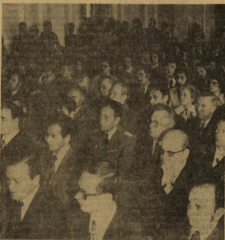
Az országos megnyitónépszerűen megjelentek egy csoportja

kaptak az Ormos Magdolna—Péter József szerzőpáros, a Szegedi Orvostudományi Egyetem hallgatói. A zsűri miniszteri okleveleket és emléklapokat adott át a konferencián kiemelkedő munkát végzett oktatóknak, a ta-