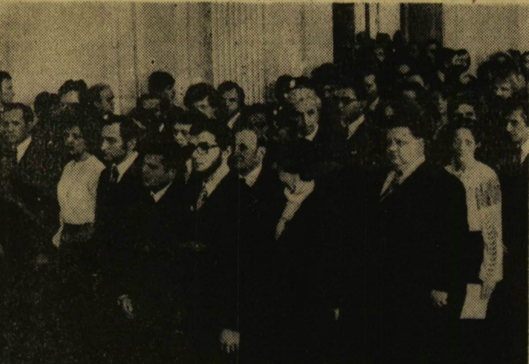
A doktornak avatottak egy csoportja

A díszdoktoravatás után az Egyetem Tanácsa a Bölcsészettudományi Karon és a Természettudományi Karon sikeres doktori szigorlatot tett 44 jelöltet avatott doktornak.