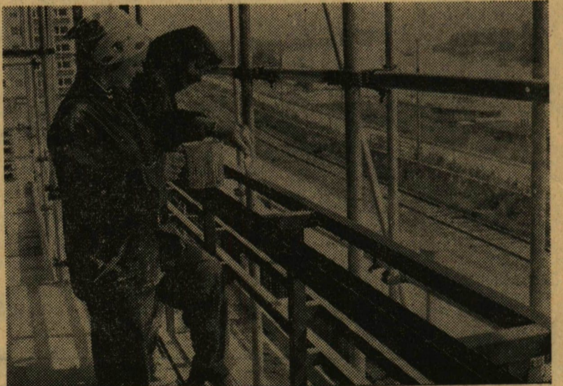
A SZOTE-s gólya lányok egy csoportja az új szegedi szállodát mázolta.