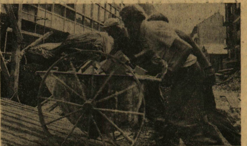
A JATE tábor résztvevői közül néhányan a Postaigazgatóság építésén dolgoztak.