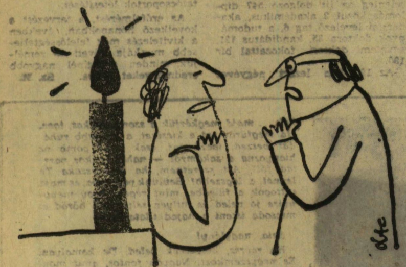
— Legújabb találmányom, nappal sötétet csinál.