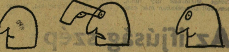
Fejlődés (Hegyi Füstös László karikatúrája)