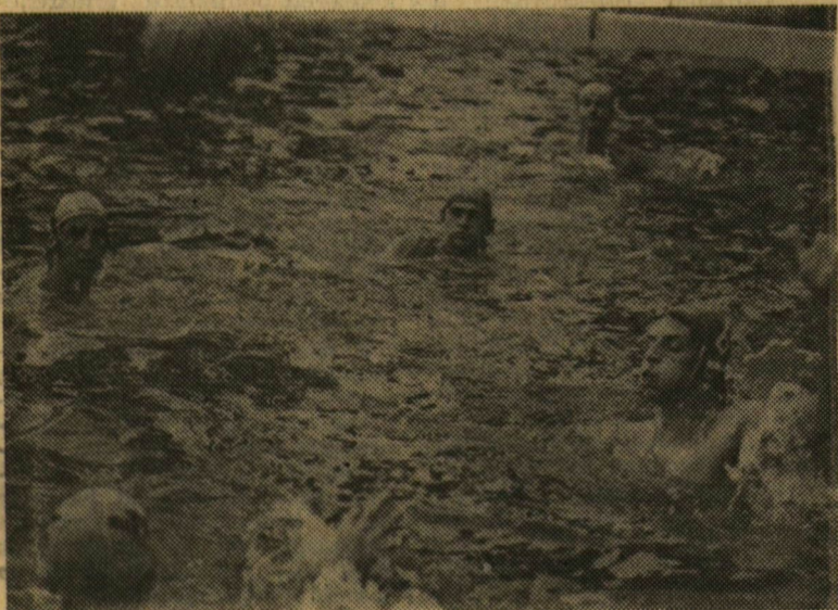
Labdalen. A SZEOL—Honvéd mérkőzés egyik érdekes jelenete. Három szegedi és két fővárosi játékos figyel a labda útját.