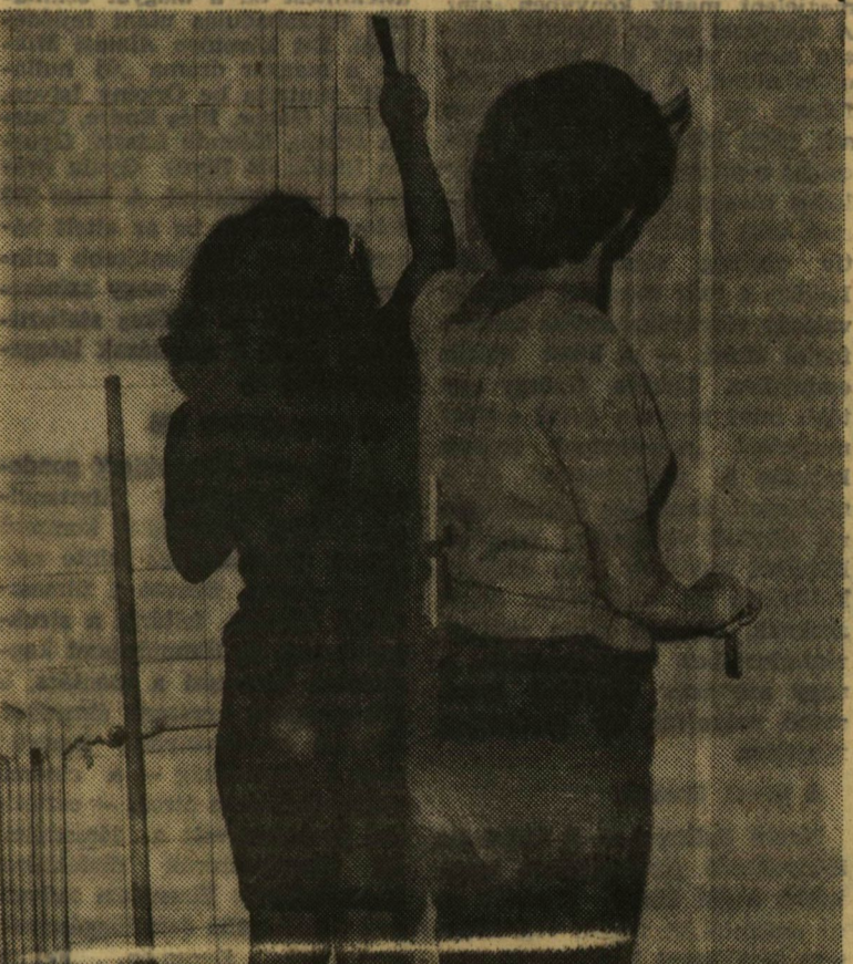
Fehér foltok!

„Az első hetek forrágában bizony még nehezen ismered ki magad. Gondoltuk: a Gólyafészkek rendezvényei lehetővé teszik, hogy összeharagadj az évfolyamtársaiddal, hogy megismerd egyetemünk életét, KISZ-szervezetünk munkáját és terveit, hogy tanévkezdéskor mint egyetemünk új polgára már ismert világba lépj be.” A Gólyafészkek 75. című füzetekében olvashatók ezek a sorok. A SZOTE KISZ-szervezete tehát sok-sok szeretettel várja elsőéveseit. A jól szervezett tábor egyszersmind a fészekrakás nehézségein is átsegítette a majdani „lakókat”.