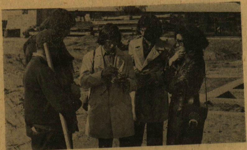
Fotóséta