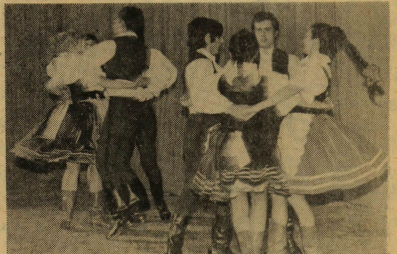
Pillanatkép a néptáncosok egyik bemutatójáról