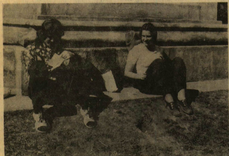
Tavaszi 1974.