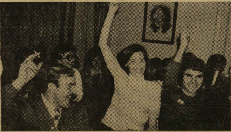
A feladat sikeres megoldása után, ujjongó vezető csapat néhány tagja

A „nonsensek” mellett persze némi tudás, bizonyos ismereteket és készségeket igénylő feladatok is szerepeltek, mint például a kocka hasábbá való átalakítása, a színek meghatározott rendjében, de volt művészettörténeti, egyetemtörténeti kérdés, s hogy mi volt az első magyar Nobel-díjas, Szent-Györgyi Albert ok-