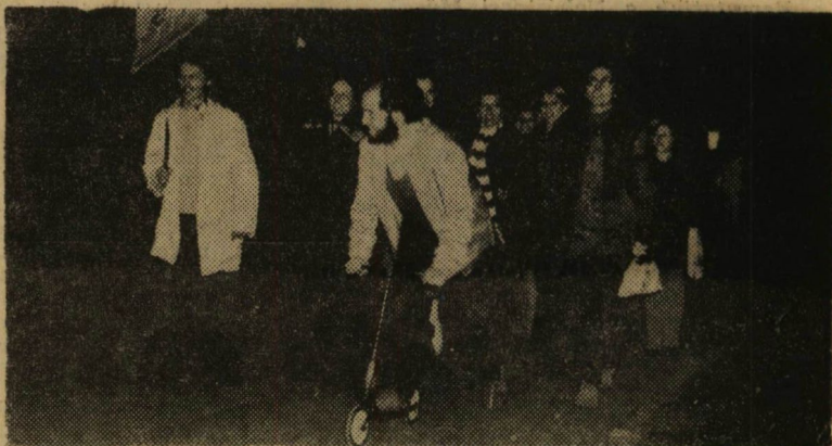
Az egyetem központi épülete felé tartó jogász csapat