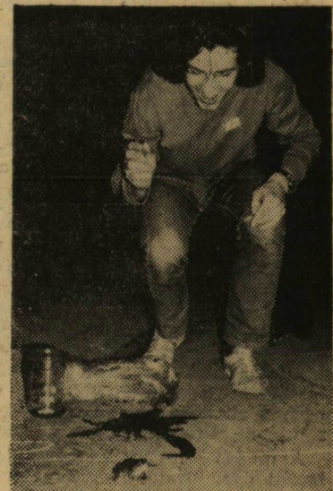
A TTK-ért ugró béka

Kissé kockázatos, de rendkívül szellemes feladat volt egy aznapi dátummal ellátott közlekedési kihágást igazoló bírságolási cédula beszerzése. Akinek szerencséje volt, az átszaladhatott egy