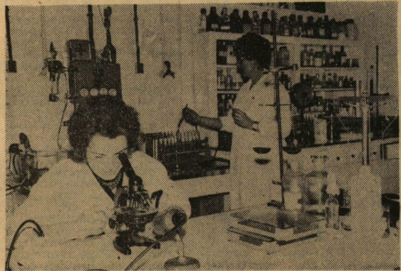
A mikrobiológiai laboratórium