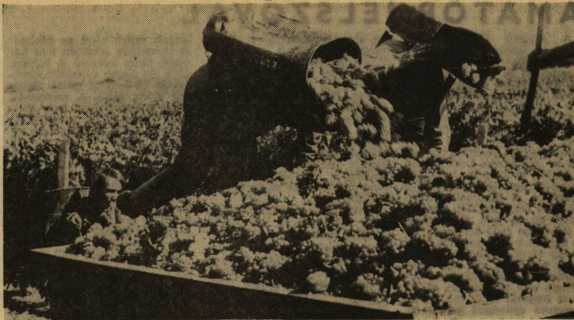
Szőlőhegy a „szőlőhegyen”

(Lapunk következő számában részletesen beszámolunk a szegedi tanácsülésen végzett munkáról).