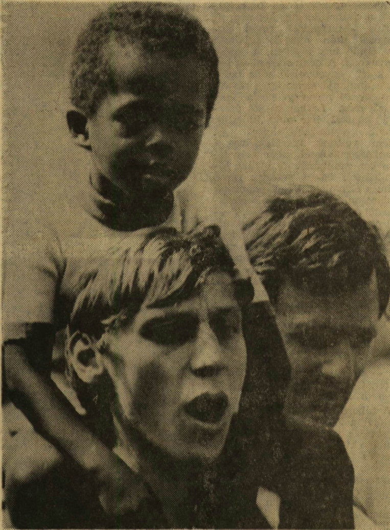
Antiimperialista szolidaritás, béke és barátság!

A VIT stafétán kétezer métert kellett kocogva megtennünk. Ha nem volt szerelésünk, adtak melegítőt és tornacipőt. Aki a távozt megvette, kis zászlócskát kapott emlékébe. Nem csak Berlinben jártam, egy napot Halléban is töltöttem. Ekkor értettem meg, hogy a VIT tulajdonképpen