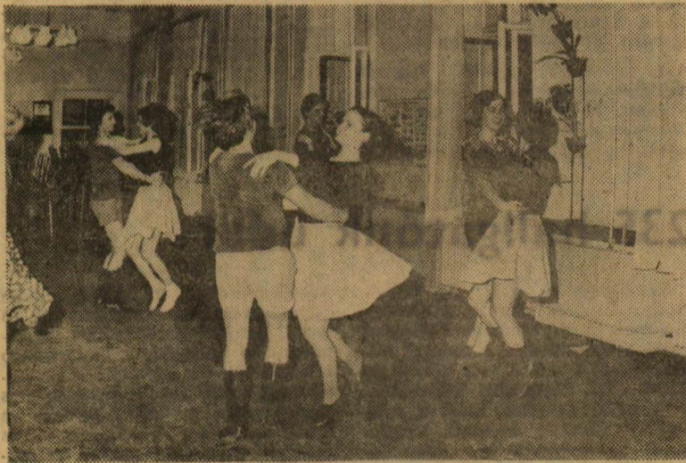
Próba közben

Próbáinkat a Hugonnay kollégiumban, a Gazdasági Hivatal menzáján tartjuk minden kedden és csütörtökön este 7—9-ig. Mindenkit szívesen látunk, aki érez magában annyi kitartást, hogy munkánkba bekapcsolódjon, és aki érdeklődik a néptánc iránt. Elsősorban azonban alsóbb évesek jelentkezésére számítunk, mert ahhoz, hogy valaki megtanuljon táncolni, több évre van szükség.