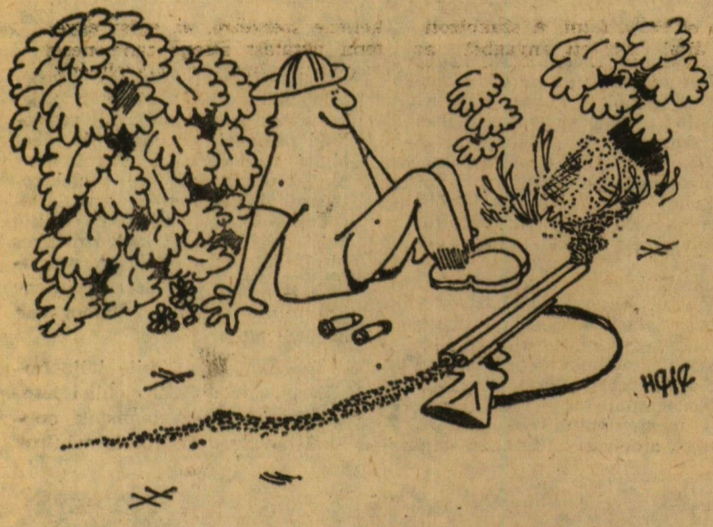
Puskatisztítás (Hevesi Ferenc karikatúrája)

Befejezésül még elmondta Litsch elvtárs, hogy idén nyáron is nagyon várják a szegedi egyetemistákat. Reméli, hogy a munka mellett marad idejük pihenésre, szórakozásra, arra, hogy erőt gyűjtsenek a következő tanévre. S. M.