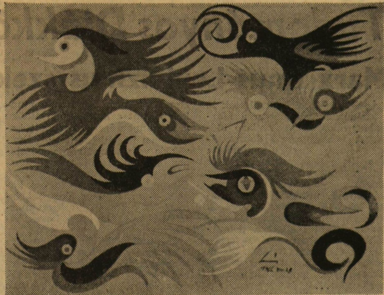
Egy kép a Lehel István festőművész hagyatékából rendezett kiállításról, amelyet a klub átadásának napján nyitottak meg.

A klub a vizsgaidőszakra való tekintettel május 14-től programszünetet tart, nyitvatartási idő naponta 14 órától.