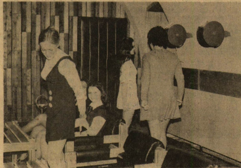
A boltíves, faburkolatú, modern, kényelmes bőrfotelokkal és kis asztalokkal berendezett nagy társalgó.